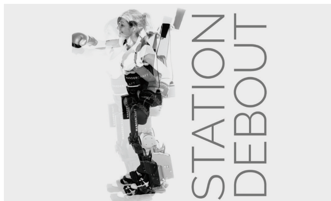
Les patients de « Station Debout » bénéficieront des technologies de rééducation les plus avancées, comme l'exosquelette de marche Atalante.

L'Institut finance depuis plus de 30 ans des projets de recherche fondamentale et clinique, et représente les patients paraplégiques ou tétraplégiques à la suite d'un traumatisme médullaire. « Ce dispositif complet, financé uniquement par des dons, offre une réponse concrète aux besoins des personnes touchées par des lésions de la moelle épinière mais aussi pour les pathologies médullaires. »